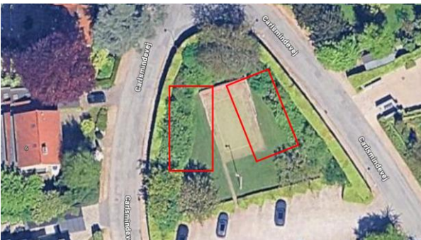
Figur 1 Forslag til placering med slåmur mellem

Der er indhentet tilbud på anlæggelse af 2 minibaner på Carlen, og der er en pågående dialog med kommunen vedr placering og tilladelser og det praktiske omkring disse. Det er håbet, at disse kan godkendes og etableres så hurtigt som muligt - dels for at vi kan få spillet en masse mini tennis, men også for at frigøre banekapacitet på de store baner. Hvis banerne godkendes af kommunen, får vi hårdt brug for medlemmer, der kan hjælpe med at få finansieringen på plads. Måske har du en god idé til sponsorer, lyst til at være medsponsor eller har erfaring med at søge fonde. Lad os det gerne vide.